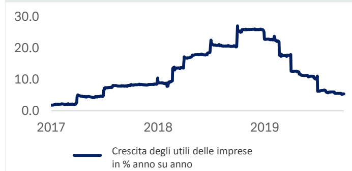
Grafico 2: Andamento annuo degli utili delle aziende statunitensi