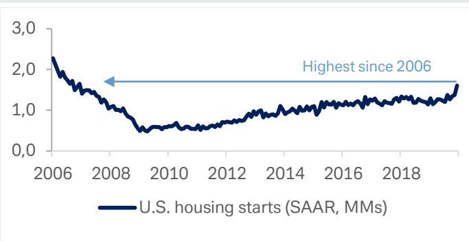
Grafico 1: nuovi cantieri edili a dicembre